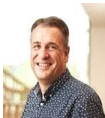
Leder af Plan og Erhverv Vejen Kommune

Det går godt i Vejen som handelsby, og vi arbejder proaktivt for det skal gå endnu bedre i fremtiden, byen er nemlig centrum for hele kommunen og I skal være meget velkomne til at være med.